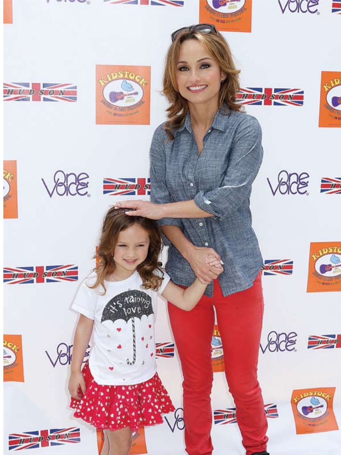
جيدا دي لاورينتيز وابنتها خلال حضورهما مهرجان الفن والموسيقى السابع في بيفرلي هيلز بكاليفورنيا.

ووجد علماء بجامعة بافالو وفيرمونت بالولايات المتحدة، أن النساء اللاتي تناولن وجبة غداء تتألف من المكرونة والجبن يوميا لمدة أسبوع استهلكن في نهاية الأمر 100 سعر حراري أقل خلال فترة 24 ساعة. وقد تحدثت بعض التقارير بالفعل عن اتباع النجمة الأمريكية جينيفر انستون لنظام غذائي مماثل خلال فترة مشاركتها في المسلسل الشهير الأصدقاء تضمن تناول نفس نوع السلطة لسنوات متتالية.